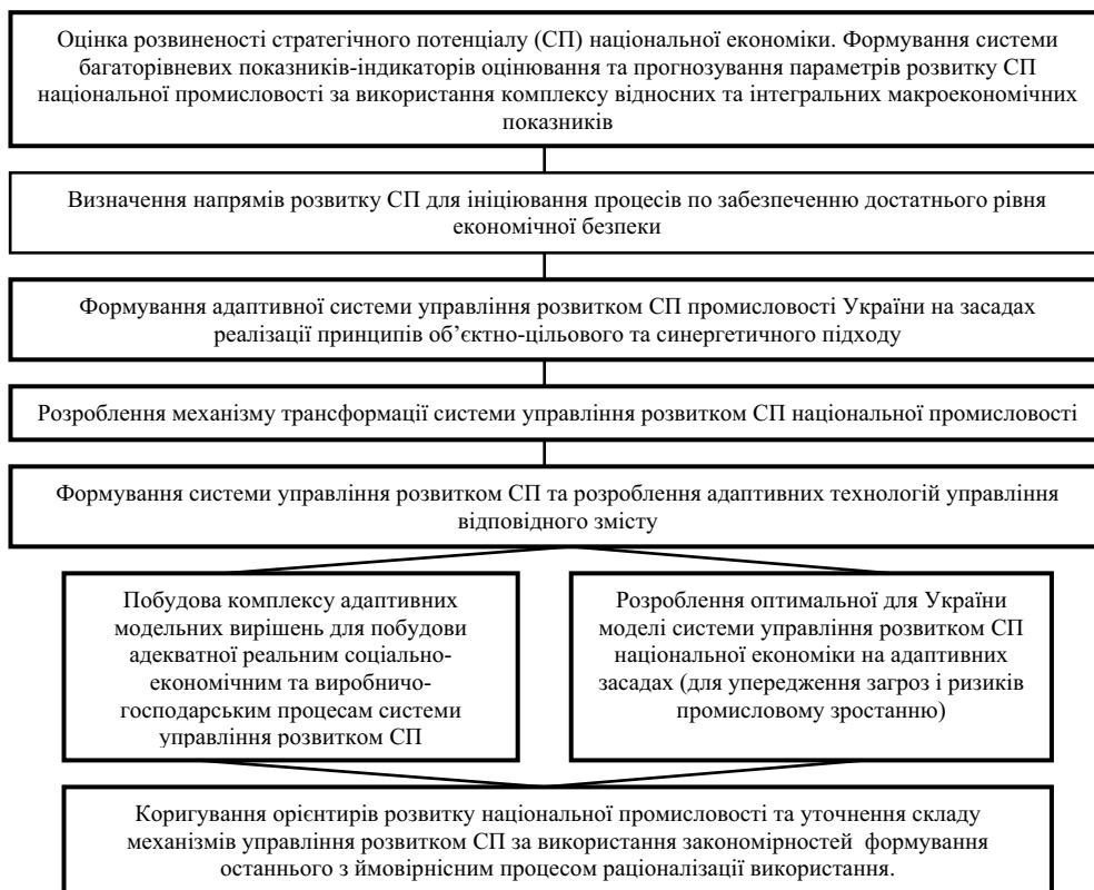
Рис. 1. Етапи процесу трансформації стратегічного потенціалу національної промисловості

Відповідно до зазначеного слід підкреслити місце і роль системи управління розвитком стратегічного потенціалу національної економіки, і промисловості зокрема, в системі забезпечення економічної безпеки і здійснити синтез системи управління ним.