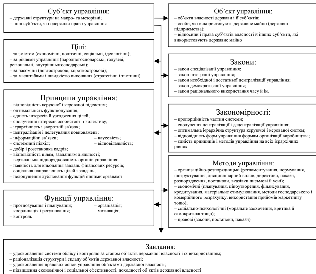
Рис. 1. Основні елементи системи управління державною власністю

Оцінку ефективності управління власністю необхідно проводити також виходячи з рівнів управління в галузі досліджень і розробок: загальнодержавного, галузевого, регіонального, господарського, окремо виділяючи рівень управління з боку суб'єктів власності. Для оцінки ефективності управління об'єктами власності в процесі виробництва доцільно розглядати наступні напрями: визначити ефективність організації і функціонування системи управління з урахуванням ефективності роботи підприємства, використовуючи систему не лише кількісних, але й якісних показників. Шляхом порівняння зазначених показників з попередніми періодами або з показниками інших підприємств виявляти рівні і динаміку зміни ефективності управління власністю в наукомістких організаціях (рис. 2).