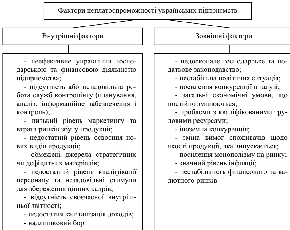
Рис. 2. Основні фактори неплатоспроможності українських підприємств

Він повинен знайти і запропонувати найбільш раціональні способи реагування на зовнішні ризики, обумовлені невизначеністю зовнішнього середовища. Чим більше виявлено неясностей, тим більший ризик, тим складніше приймати ефективні рішення.