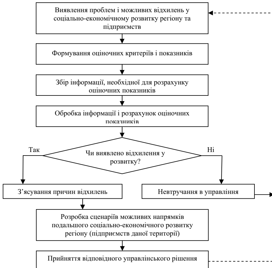
Рис. 2. Схема процесу моніторингу соціально-економічного розвитку регіону та підприємств, розташованих на даній території

Якщо відхилень не виявлено, приймається рішення про невтручання в систему управління соціально-економічним розвитком регіону (підприємства), у протилежному ж випадку з'ясовуються причини цих відхилень; на основі з'ясованих причин відхилень розробляються сценарії можливих напрямків подальшого соціально-економічного розвитку; розглянувши можливі сценарії розвитку, керівництво приймає відповідні управлінські рішення.