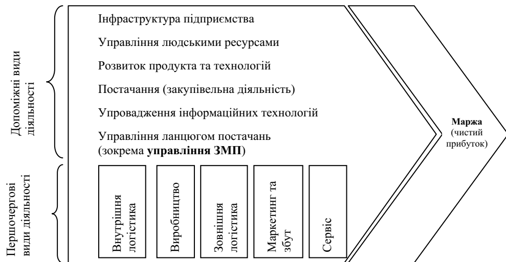
Рис. 2. Місце управління ЗМП у ланцюзі створення вартості М. Портера (розроблено автором на підставі [32; 34])

Управління ЗМП, на нашу думку, доцільно здійснювати в контексті управління ланцюгом постачань (Supply chain management). На думку дослідників [32], процес управління ланцюгом постачань (SCM) доцільно розглядати як додатковий вид діяльності в ланцюзі створення вартості підприємства М. Портера. Управління ланцюгом постачань розглядають також як окремий етап створення вартості в логістиці, якому притаманне зменшення інтенсивності капіталовкладень та збільшення інтенсивності управління. SCM націлено на управління всіма процесами в логістичному ланцюзі постачань, а також самим ланцюгом постачань. Саме управління ланцюгом процесів має сьогодні велике значення, оскільки внаслідок зростання поділу праці та зменшення частки участі у виробництві кінцевого продукту у підприємства скорочується спектр виробничих функцій [33].